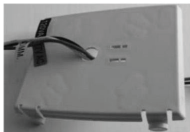
Fig. A (J-Box)